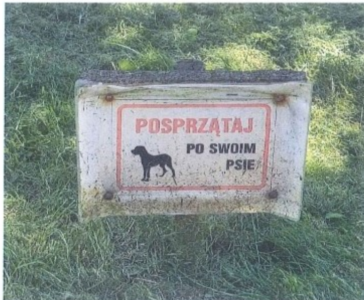
Fot. 1. Tabliczka na Pl. Słowackiego.