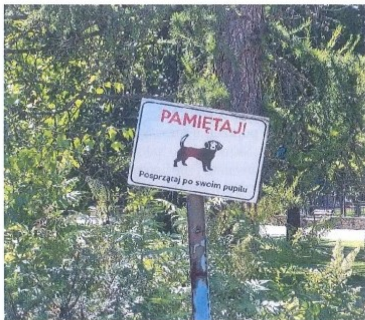
Fot. 1. Tabliczka w Parku Miejskim im. A. Mickiewicza.